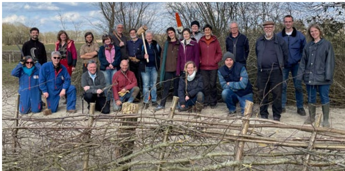
Foto hieronder: happy cursisten! (klik hier voor grotere afbeelding)