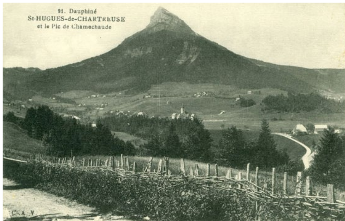
Le Pic de Chamechaude

Leuk allemaal maar waarom begin ik hierover? Niet vanwege de bergpiek of het oude kasteel maar om wat we op de voorgrond van deze foto's zien, die ruim honderd jaar geleden genomen zijn: gevlochten heggen. Het is een afwijking als je daar telkens weer op gespist ben, ik geef het toe, maar geen onplezierige. Op de voorgrond van de Chamechaude is een prachtige, waarschijnlijk in de voorgaande winter gevlochten heg te zien. Een dichte ondoordringbare heg van 100-120 cm hoog, afgewerkt met dikke, gekloofde palen met binders er overheen gevlochten. Duidelijk geen wedstrijdstyl maar oerdegelijk en nog altijd zo in delen van Frankrijk te bewonderen. De tweede foto laat ook het gebruik van gekloofde palen zien. Er is hier heel intensief gevlochten. Deels lijkt het levend en deels dood hout. Mogelijk is de heg na enkele jaren opnieuw gevlochten. Ook deze intensieve wijze van vlechten met betrekkelijk dik hout is nu nog in Frankrijk te bewonderen.