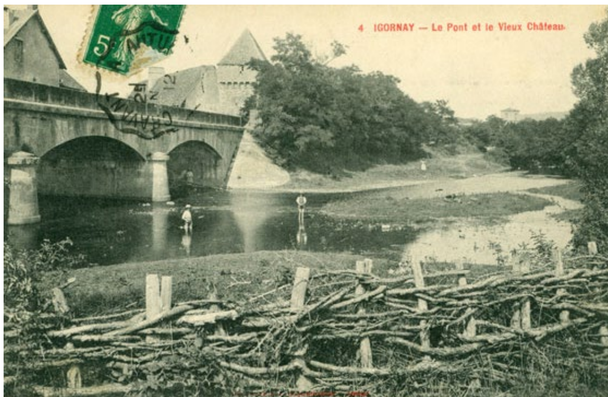
De brug en het kasteel van Igornay.

Ik begin hierover omdat sommigen in onze passievolle gemeenschap van heggenvlechters de mening zijn toegedaan dat het werken met palen en binders een louter Engelse aangelegenheid is. Dat het niets met traditionele vlechtstijlen op ons continent te maken heeft en nooit heeft gehad. Dat we afvalligen zijn, Engelsen napaen, ons erfgoed niet respecteren, kortom niet echt goed bezig zijn. Het is hier al vaker gezegd, heggenvlechten is levend erfgoed, altijd geweest. Iedereen moet vooral vlechten op een manier die hij of zij goed en passend vindt. Buigen, knikken, levende paaltjes, dode paaltjes, allebei, wel of geen binders, traditioneel of vernieuwend, het kan allemaal, zoveel zielen zoveel vreugd. Maar dat paaltjes en binders in heggen vroeger enkel in Engeland gevonden konden worden, dat klonk toch al niet erg waarschijnlijk, wel?